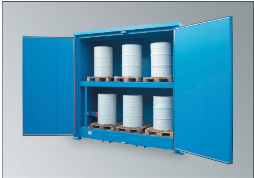
WSC-T-E.2-30, Artikel-Nr. C22-5013-T