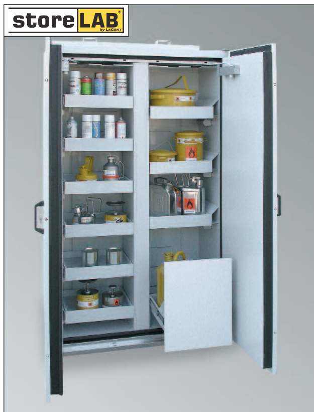
SIS Typ 90 / 1200 ES MI, Artikel-Nr. B80-2556-B, RAL 7035, inkl. 6 Auszugsböden (links) und 3 Auszugsböden sowie 1 Entsorgungsfach (rechts)