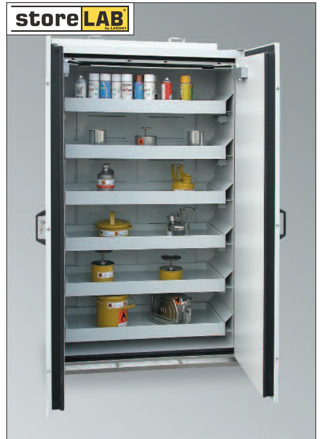
SIS Typ 90 / 1200 VS6, Artikel-Nr. B80-2534-B, RAL 7035, inkl. 6 Auszugsböden