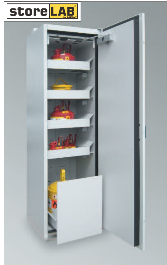
SIS Typ 90 / 600 VS4-ES, Artikel-Nr. B80-2588-B, RAL 7035, inkl. 4 Auszugsböden und 1 Entsorgungsfach