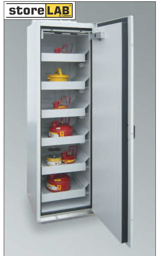
SIS Typ 90 / 600 VS6, Artikel-Nr. B80-2570-B, RAL 7035, inkl. 6 Auszugsböden