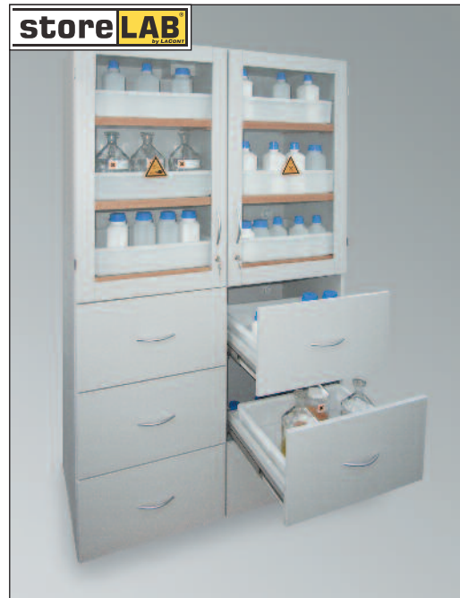
SLS 1200 GL/6-SF6, Artikel-Nr. B80-3027-D