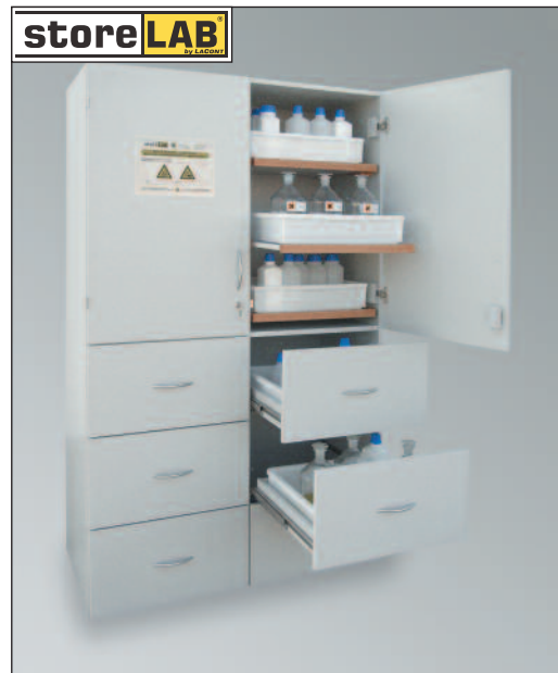
SLS 1200/6-SF6, Artikel-Nr. B80-3025-D