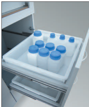
Vollauszugsschubfach mit Endanschlag