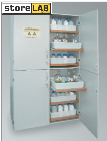
SLS 1200/12, Artikel-Nr. B80-3016-D