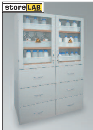
SLS 1200 GL/6-SF6, Artikel-Nr. B80-3027-D