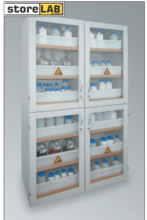
SLS 1200 GL/12, Artikel-Nr. B80-3023-D