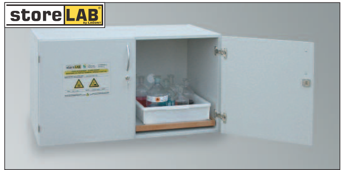
SLS-AUS 1100, Artikel-Nr. B80-2823-A