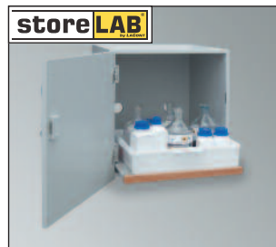
SLS-AUS 600, Art.-Nr. B80-2859-A