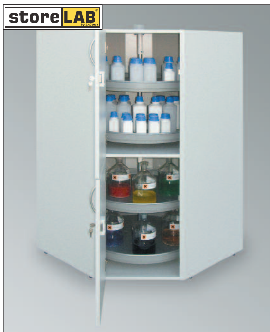
SLS-ECK 2, Artikel-Nr. B80-2862-A