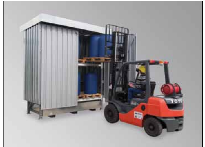
QGC 2/30, Artikel-Nr. R26-2100-A