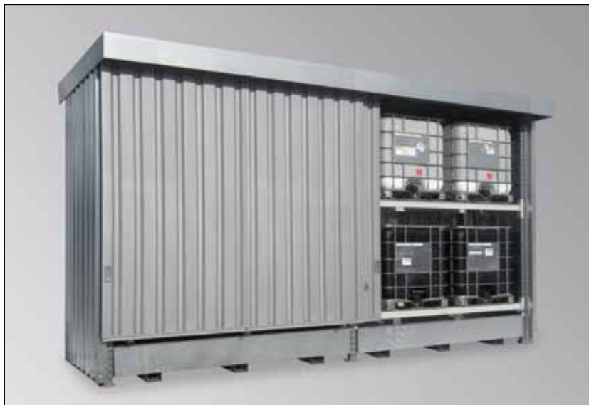
QGC 2/30, Artikel-Nr. R26-2100-A