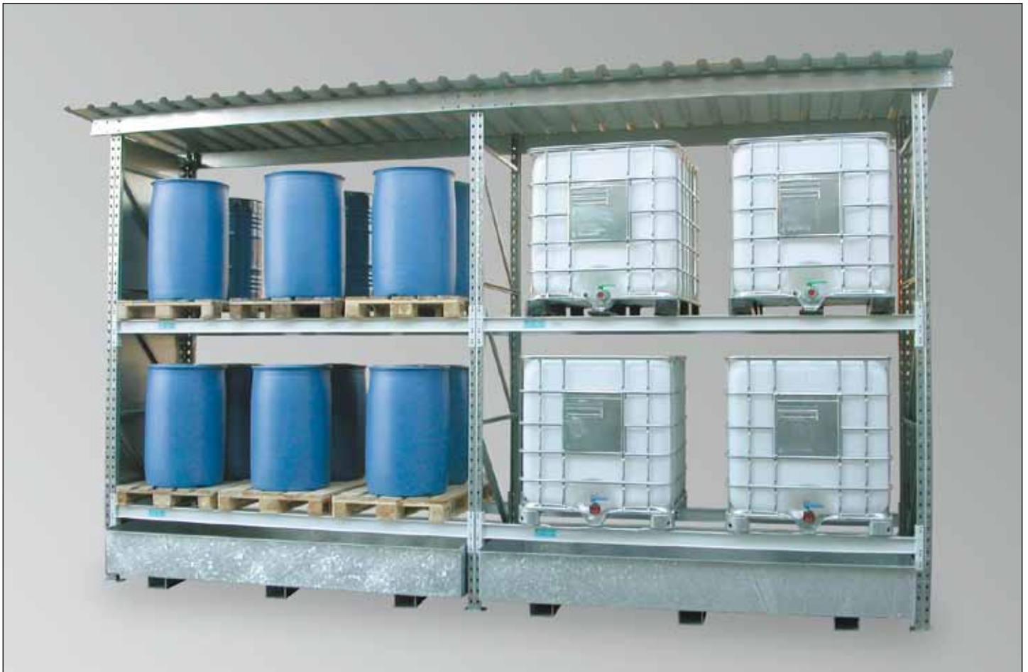
FPR-W-2736, Grundfeld, Art.-Nr. R26-3100-C und Anbaufeld, Art.-Nr. R26-3110-C, mit Seitenwandverkleidung, Art.-Nr. R26-3115-C