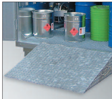
Optionale Auffahrrampe für Fasskarre