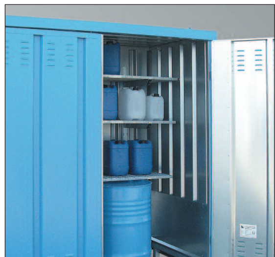
Gitterrost-Regal-Set, verzinkt, Artikel-Nr. H61-9012-C

Bei Mitbestellung eines Schaltkastens (H63-9007-A) werden die elektrischen Einbauten komplett montiert und verdrahtet bis zum außenliegenden Schaltkasten. Nur FI-geschützte Zuleitung und der Anschluss sind bauseitige Leistungen.