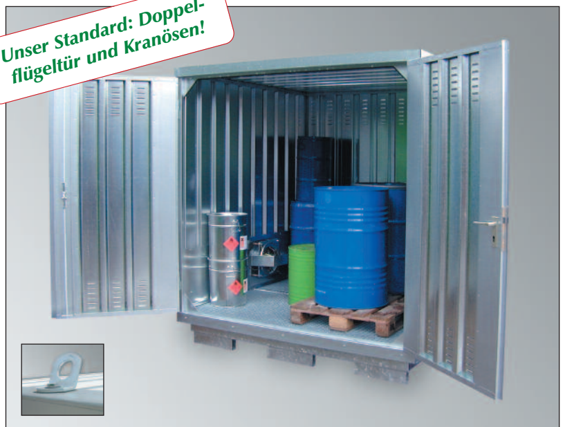
SLH 2 x 2, verzinkt, Artikel-Nr. H61-2102-B

Unser Standard: Doppel- flügeltür und Kranösen!