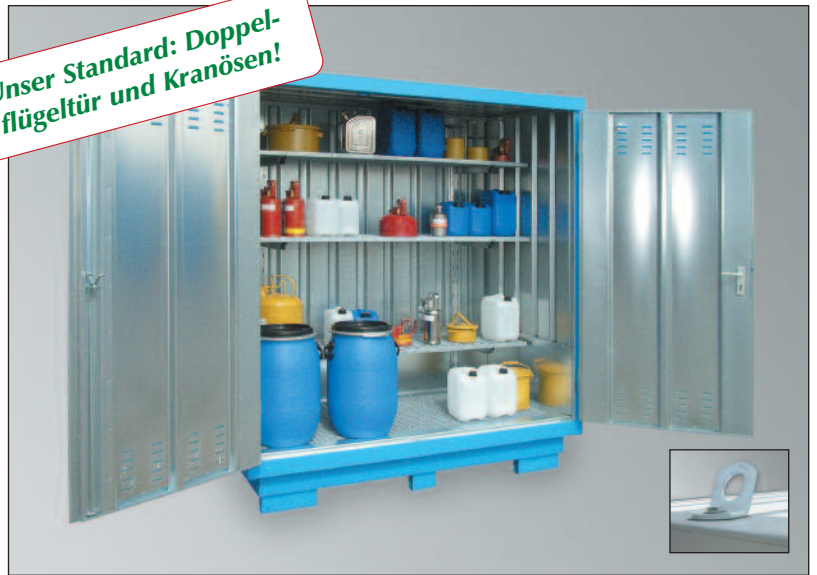
SLH 1 x 2, verzinkt und außen lackiert, Artikel-Nr. H61-6101-B, mit optionalen Regaleinbauten