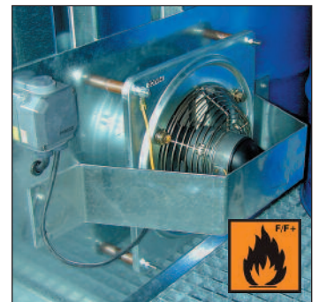
Technische Zwangsentlüftung, ex-geschützt