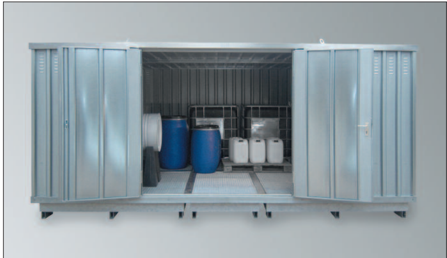
SLH 5 x 4, verzinkt, Artikel-Nr. H61-2150-A

Auch mit Wärmedämmung und Heizung lieferbar, siehe dazu Seite 108 / 109!