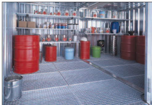
Ausrüstung mit Regalteilen