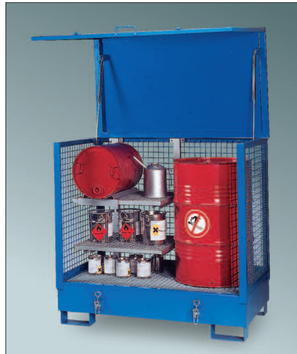
2GSKS / Gitt, mit Sonderausstattung Regal