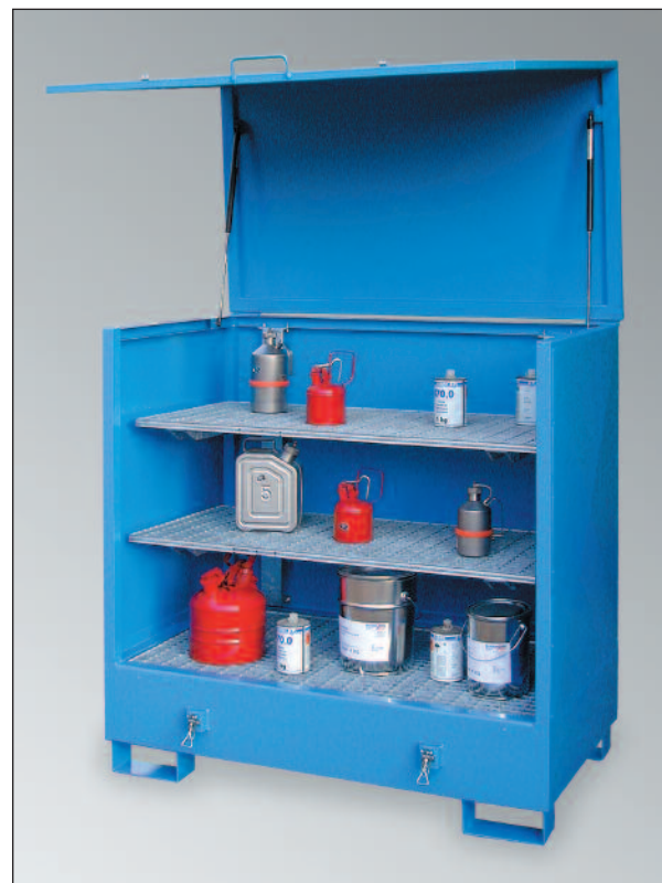
2GSKS, mit Sonderausstattung Regal