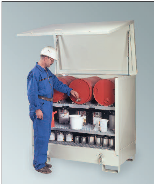
2GSKS, mit Sonderausstattung Regal