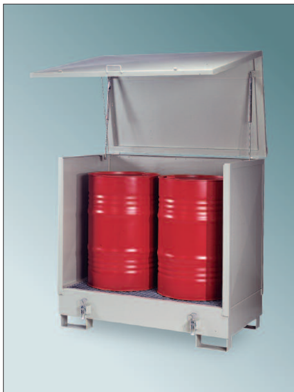
2GSKS, Artikel-Nr. P21-2503-A