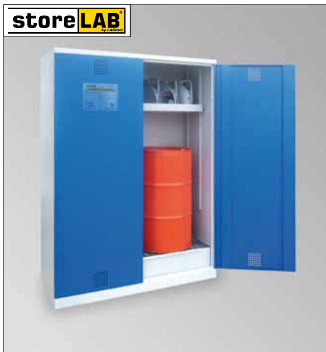
CHS-2FAS 1500, Artikel-Nr. B80-6246-A