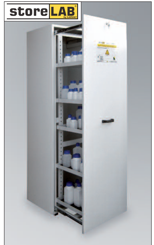
CHS-APO 600, Artikel-Nr. B80-6226-A