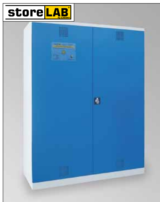
CHS-2FAS 1500, Artikel-Nr. B80-6246-A