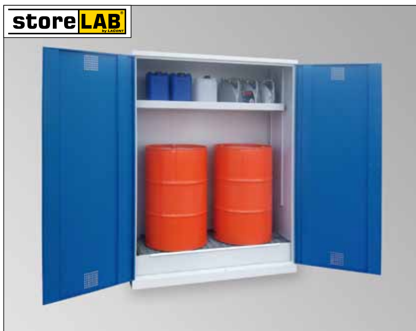
CHS-2FAS 1500, Artikel-Nr. B80-6246-A