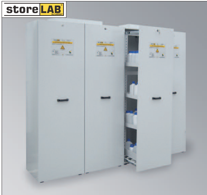
CHS-APO 2400, Artikel-Nr. B80-6229-A

☞ Inkl. Inneneinrichtung, pro Türauszug: