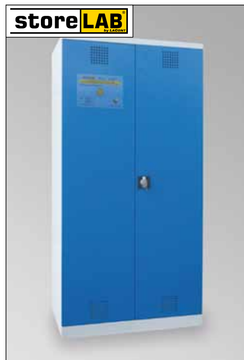
CHS-1FAS 950-660, Artikel-Nr. B80-6245-A