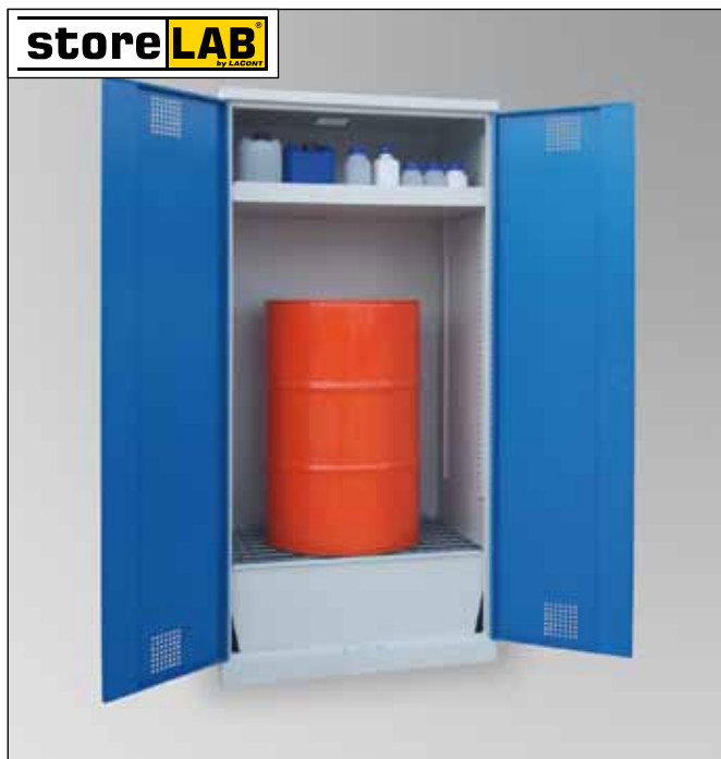
CHS-1FAS 950-660, Artikel-Nr. B80-6245-A