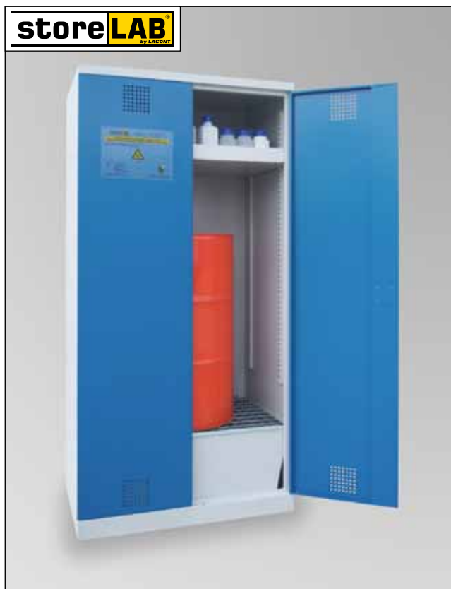
CHS-1FAS 950-660, Artikel-Nr. B80-6245-A