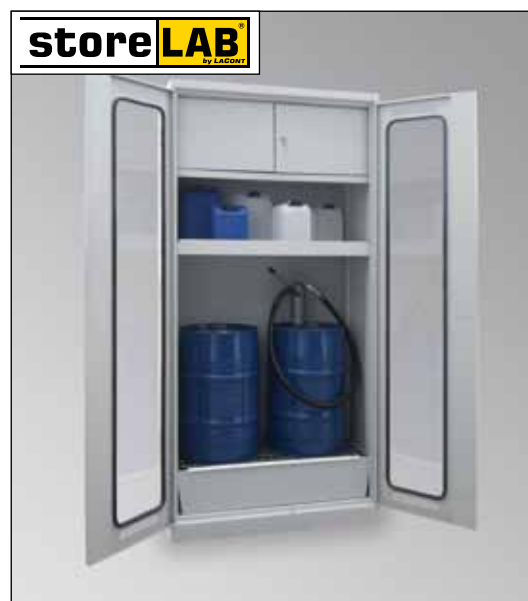
CHS-2FAS 950 GL, Artikel-Nr. B80-6239-A, mit optionalem Schließfach