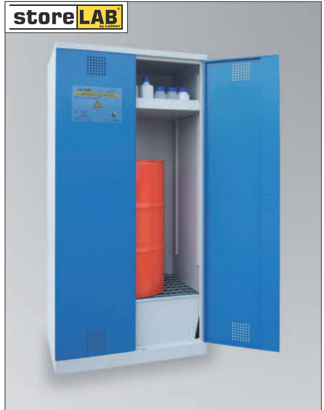
CHS-1FAS 950-660, Artikel-Nr. B80-6245-A