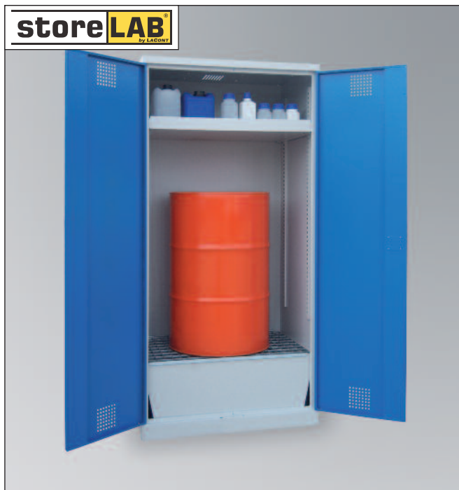
CHS-1FAS 950-660, Artikel-Nr. B80-6245-A