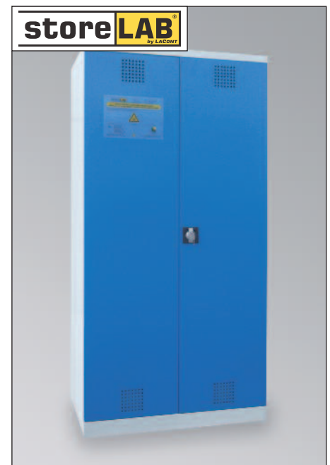
CHS-1FAS 950-660, Artikel-Nr. B80-6245-A