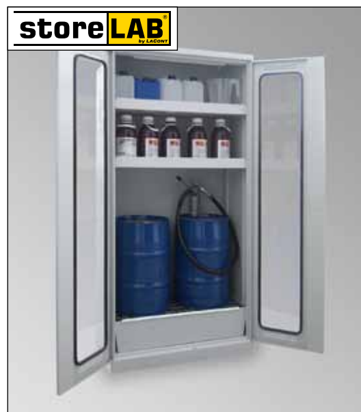
CHS-2FAS 950 GL, Artikel-Nr. B80-6239-A, mit zusätzlicher Einlegewanne