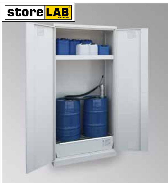
CHS-2FAS 950, Artikel-Nr. B80-6225-A