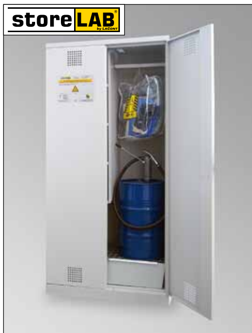
CHS-1FAS 950, Artikel-Nr. B80-6241-A