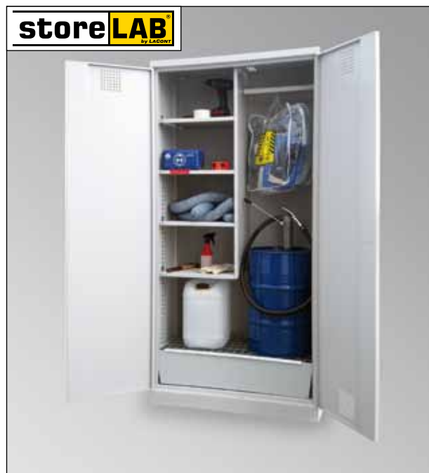
CHS-1FAS 950, Artikel-Nr. B80-6241-A