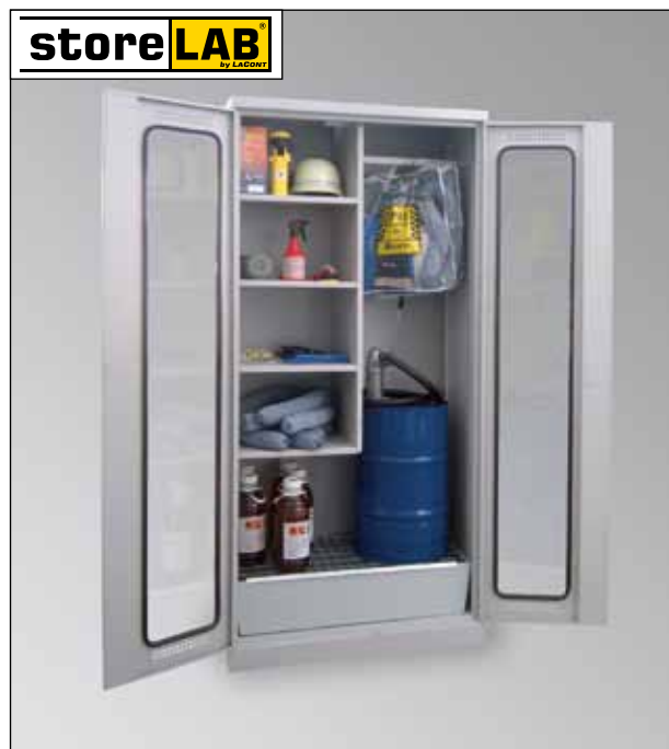
CHS-1FAS 950 GL, Artikel-Nr. B80-6242-A