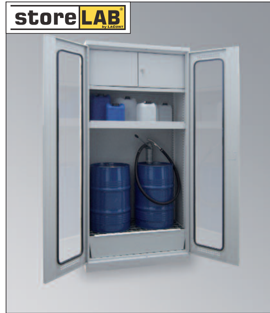
CHS-2FAS 950 GL, Artikel-Nr. B80-6239-A, mit optionalem Schließfach