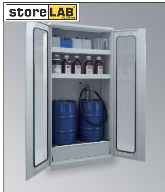
CHS-2FAS 950 GL, Artikel-Nr. B80-6239-A, mit zusätzlicher Einlegewanne