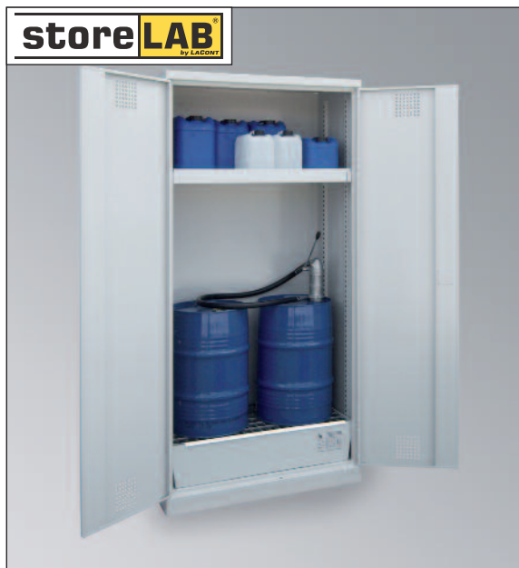
CHS-2FAS 950, Artikel-Nr. B80-6225-A