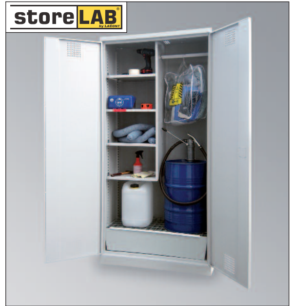
CHS-1FAS 950, Artikel-Nr. B80-6241-A