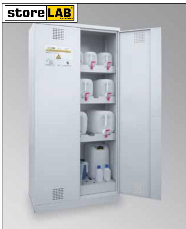
CHS-KAN 950, Art.-Nr. B80-6233-A, mit optionalem Kanister-Set