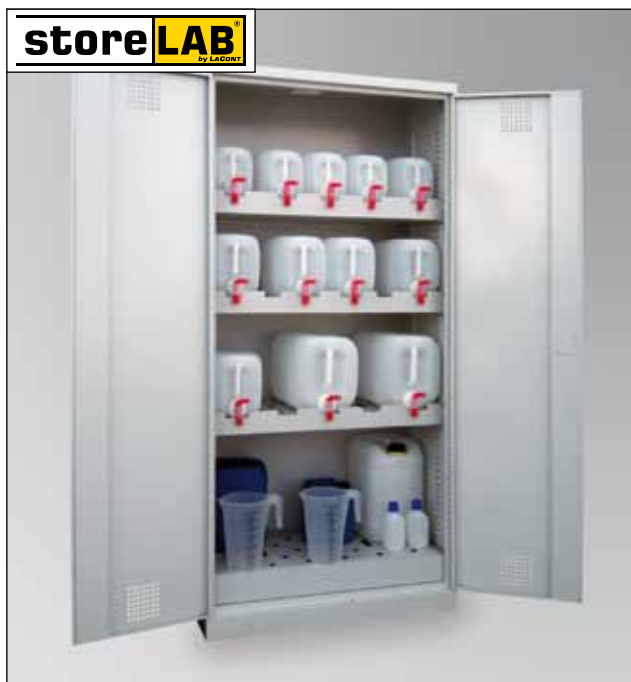
CHS-KAN 950, Artikel-Nr. B80-6233-A, mit optionalem Kanister-Set