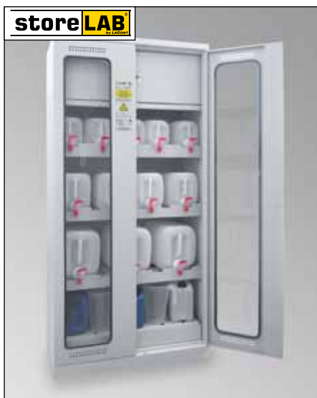
CHS-KAN 950 GL, Art.-Nr. B80-6234-A, mit optionalem Kanister-Set und Schließfach