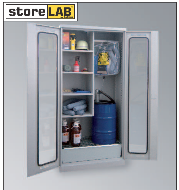
CHS-1FAS 950 GL, Artikel-Nr. B80-6242-A