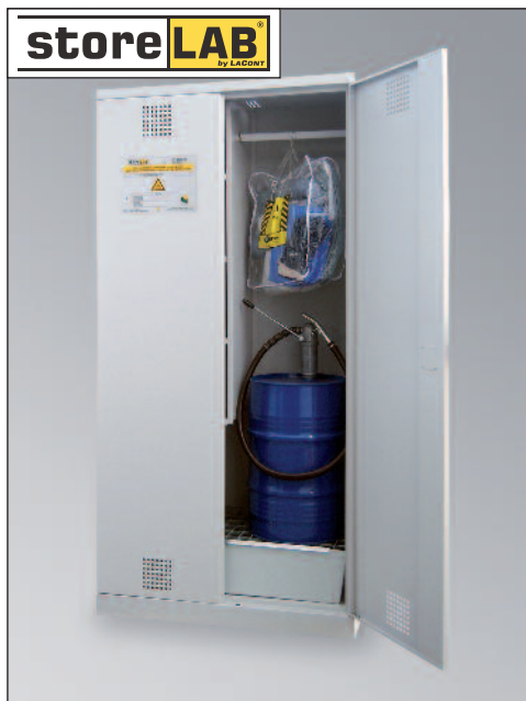
CHS-1FAS 950, Artikel-Nr. B80-6241-A