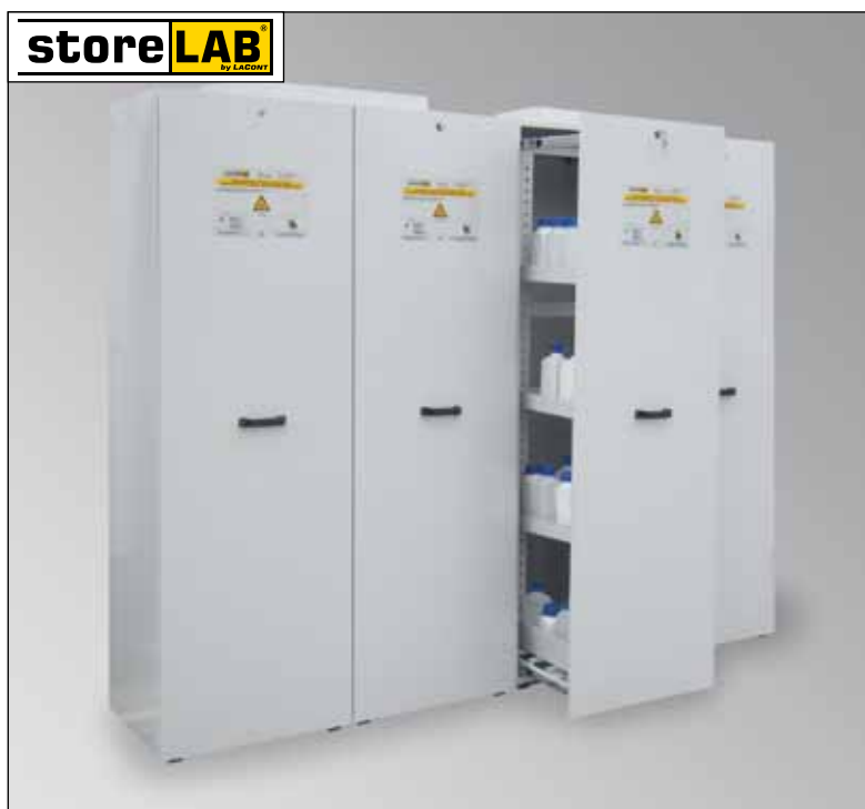
CHS-APO 2400, Artikel-Nr. B80-6229-A