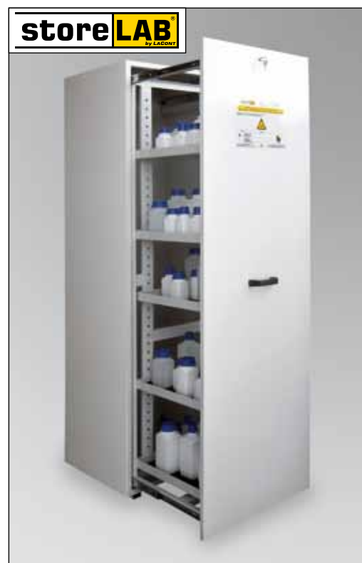
CHS-APO 600, Artikel-Nr. B80-6226-A