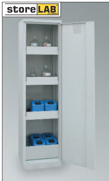
CHS 500, Artikel-Nr. B80-6211-A