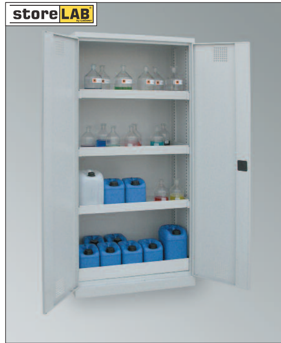
CHS 950, Artikel-Nr. B80-6210-A