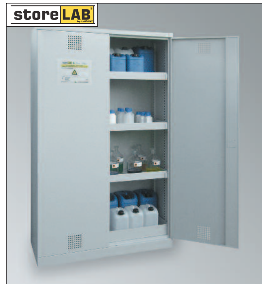
CHS 1200, Artikel-Nr. B80-6212-A