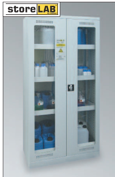
CHS 950 GL, Artikel-Nr. B80-6216-A