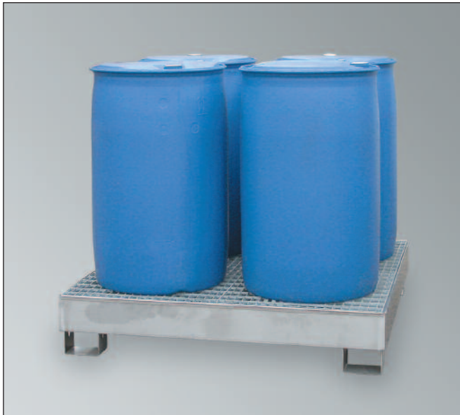
CW4-VA, Artikel-Nr. P69-3002-A