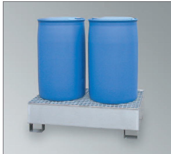
CW2-VA, Artikel-Nr. P69-3001-A