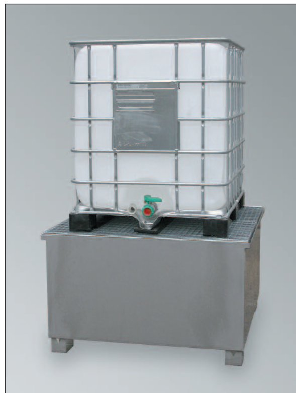
KTC-OS-VA, Artikel-Nr. P69-3003-A

Typenreihe CW2 und CW4 sind speziell zur Lagerung von 200-Liter-Fässern oder Kleingebinden geeignet.