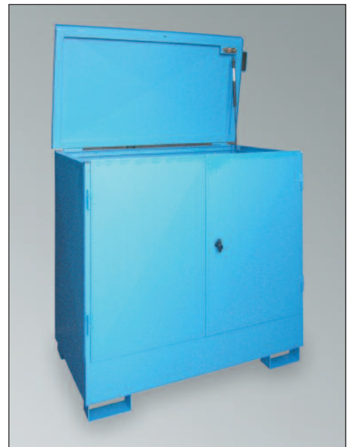
WSP-2SKKS, Artikel-Nr. P21-2431-A