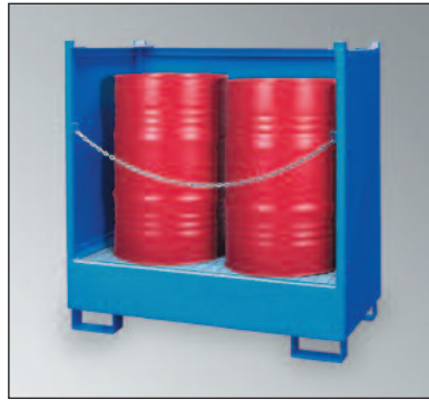
WSP-2SKS, Art.-Nr. P21-2421-A, Absperrkette optional