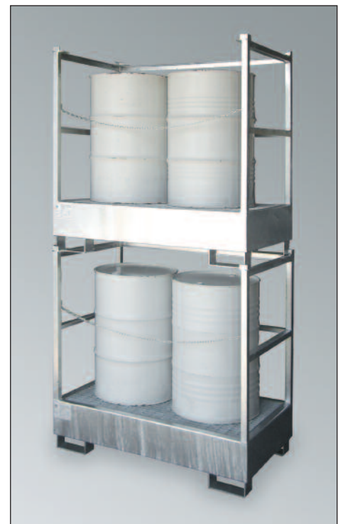
WSP-2STS, feuerverzinkt, Art.-Nr. P21-1411-A, stapelbar, Absperrketten optional