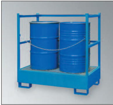
WSP-2STS, Art.-Nr. P21-2411-A, Absperrkette optional