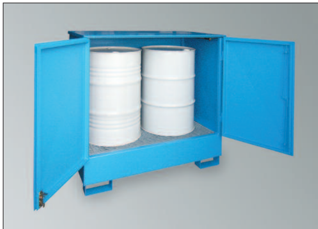
WSP-2SKKS, Artikel-Nr. P21-2431-A