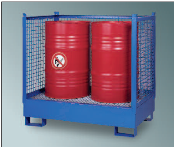
2SKS / Gitt, Artikel-Nr. P21-2501-A