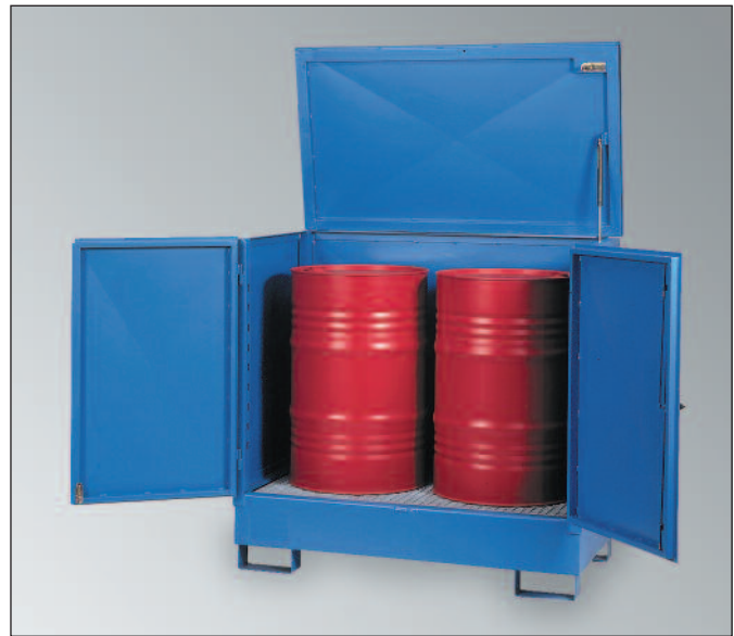
WSP-2SKKS, Artikel-Nr. P21-2431-A