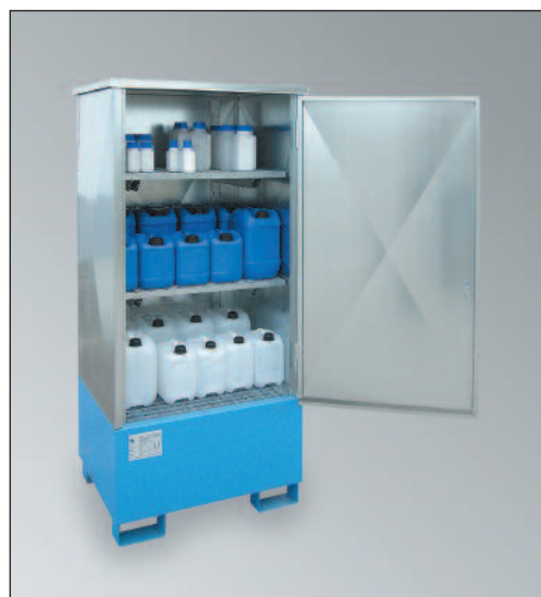
WSP-1SKKS-D/GR, Artikel-Nr. P21-2482-A