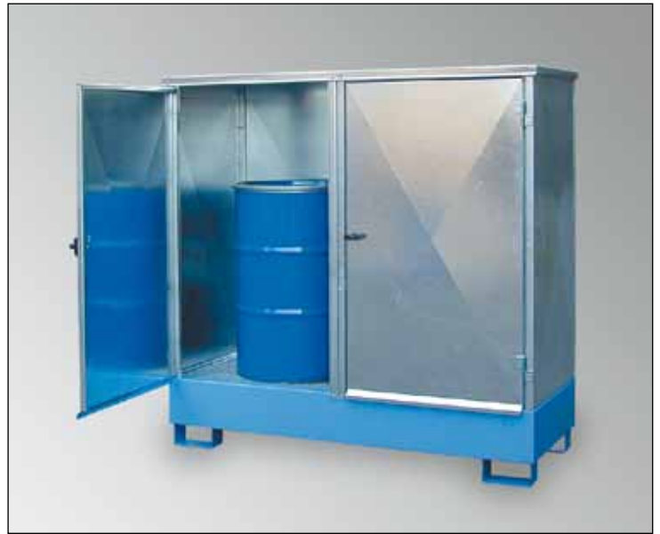
WSP-2SKKS-D, Artikel-Nr. P21-2481-A