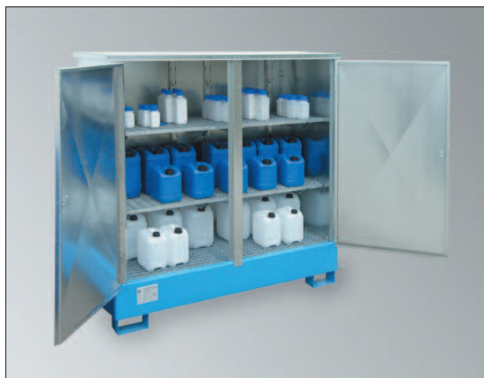
WSP-2SKKS-D/GR, Artikel-Nr. P21-2483-A