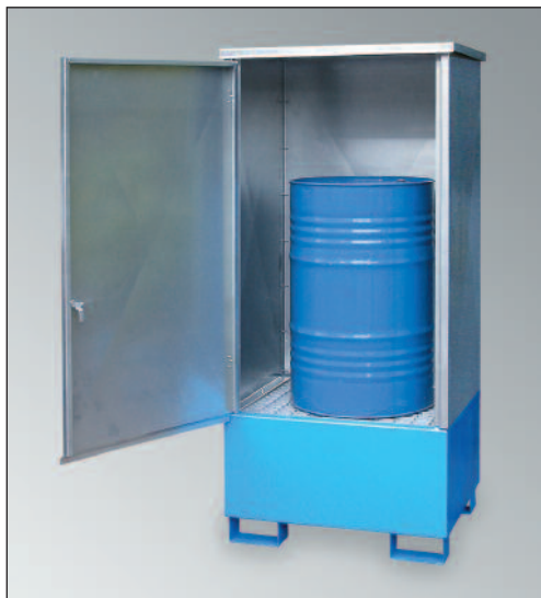
WSP-1SKKS-D, Artikel-Nr. P21-2480-A