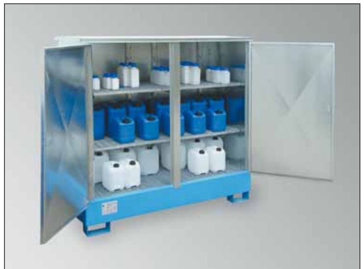
WSP-2SKKS-D/GR, Artikel-Nr. P21-2483-A