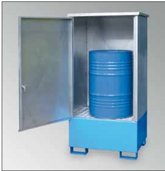
WSP-1SKKS-D, Artikel-Nr. P21-2480-A