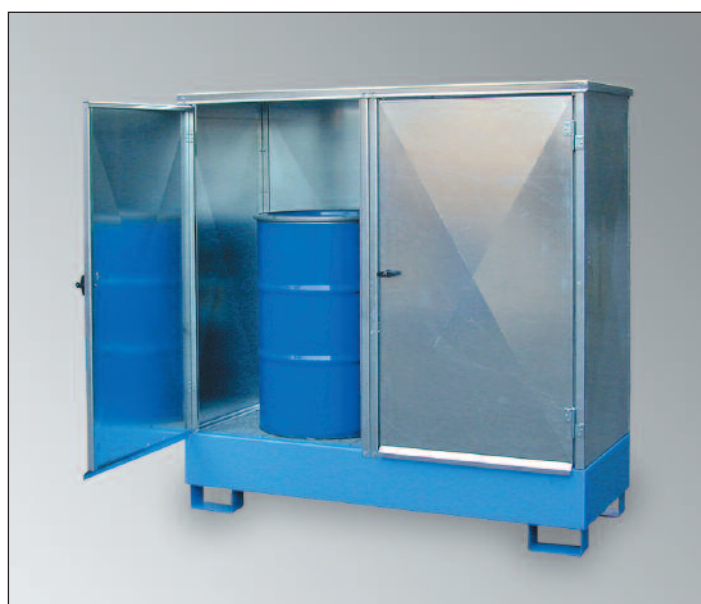
WSP-2SKKS-D, Artikel-Nr. P21-2481-A