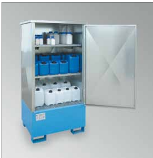
WSP-1SKKS-D/GR, Artikel-Nr. P21-2482-A