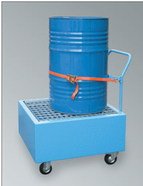
WSP-1OS/W, Art.-Nr. P21-2406-A, mit optionalem Zurrurt

Passende Fassböcke finden Sie auf Seite 11!