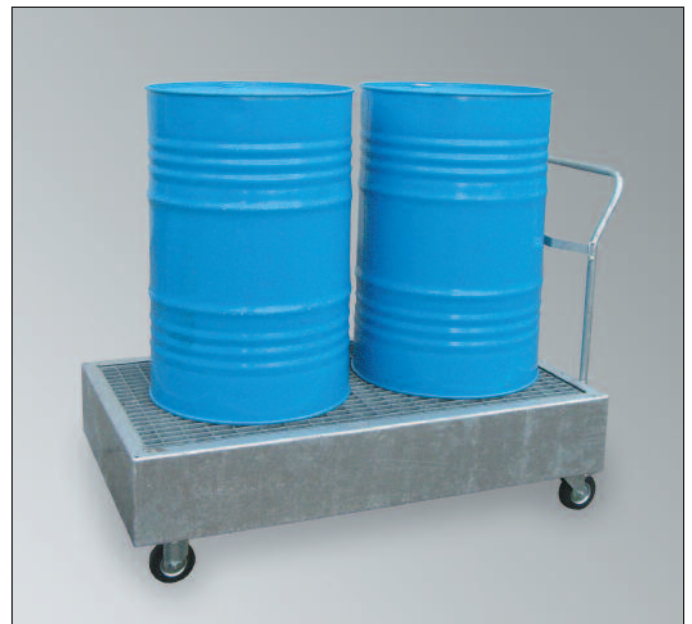
WSP-2OS/W, Art.-Nr. P21-1407-A

Fasswagen aus PE finden Sie auf Seite 32 !