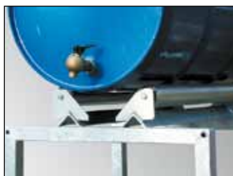
Drehbare Rollenauflage, Artikel-Nr. Z50-1925-A

Fasswagen aus PE finden Sie auf Seite 42/43!