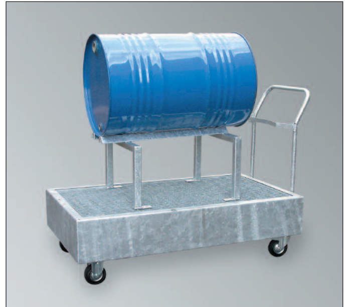
WSP-2OS/W, feuerverzinkt , Art.-Nr. P21-1407-A, mit optionalem Fassbock