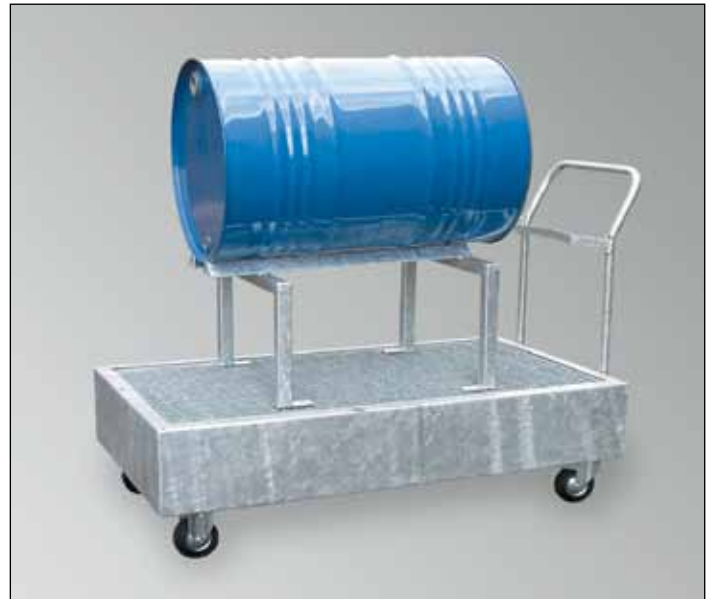
WSP-2OS/W, feuerverzinkt, Art.-Nr. P21-1407-A, mit optionalem Fassbock