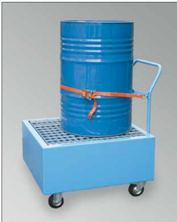
WSP-10S/W, Art.-Nr. P21-2406-A, mit optionalem Zurringurt