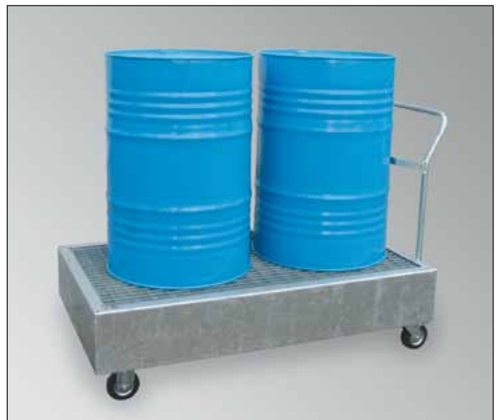
WSP-2OS/W, Art.-Nr. P21-1407-A

Passende Fassböcke finden Sie auf Seite 15!