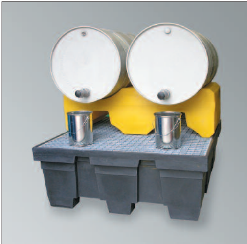
FB 2/200, Artikel-Nr. P70-7114-A