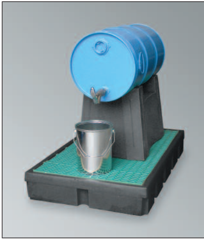
FB 1/60, Artikel-Nr. P70-7111-A