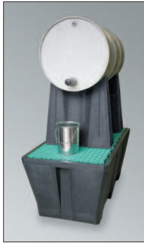
FB 1/200, Art.-Nr. P70-7112-A