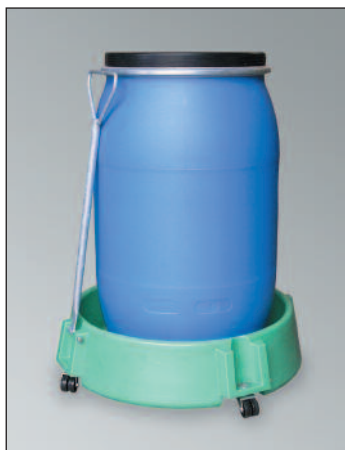
FR-PE-200, Artikel-Nr. P70-7150-A