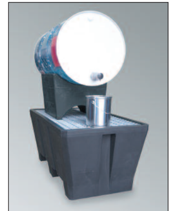
FB 1-Kombi, Artikel-Nr. P70-7115-A