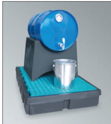
FB 1-Kombi, Artikel-Nr. P70-7115-A