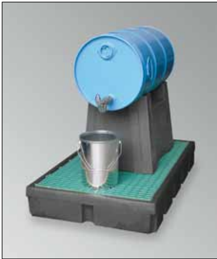
FB 1/60, Artikel-Nr. P70-7111-A