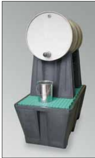
FB 1/200, Art.-Nr. P70-7112-A