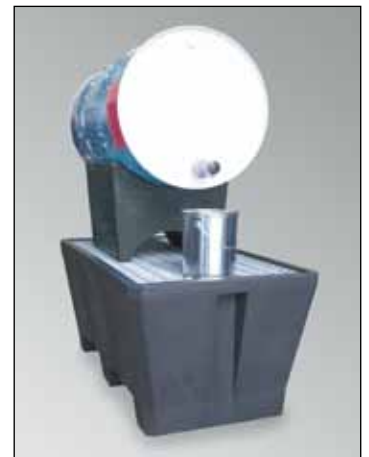
FB 1-Kombi, Artikel-Nr. P70-7115-A