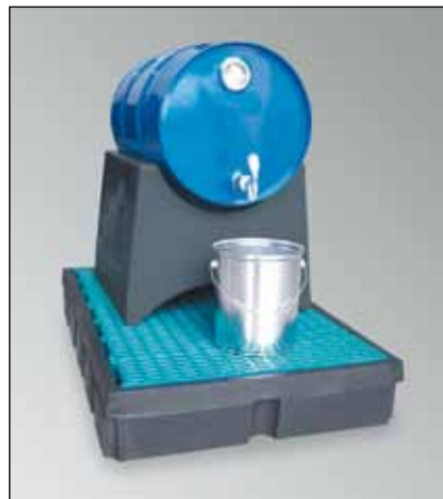
FB 1-Kombi, Artikel-Nr. P70-7115-A