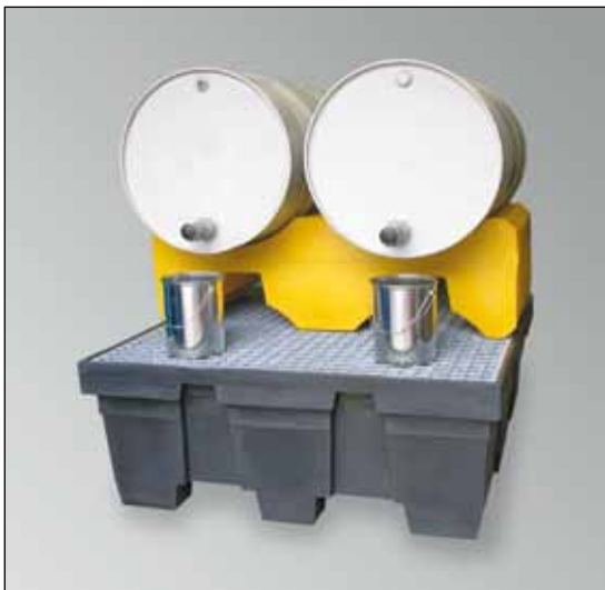
FB 2/200, Artikel-Nr. P70-7114-A